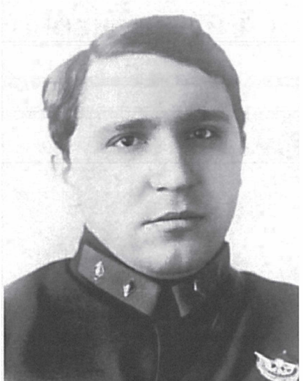
Комдив Медведев М.Е. Первый начальник МПВО с 1932 г. по 1934 г.