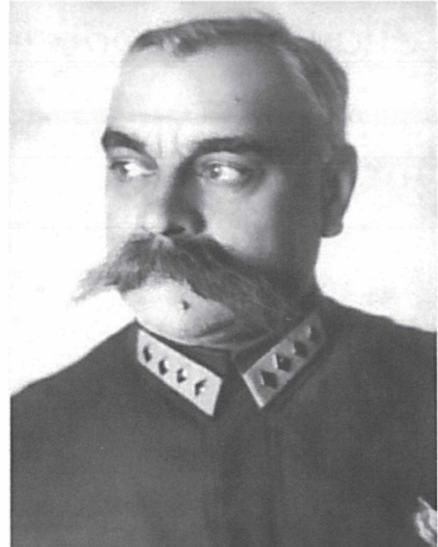
Командарм первого ранга Каменев С.С. Начальник управления ПВО РККА (МПВО) с 1934 г. по 1936 г.