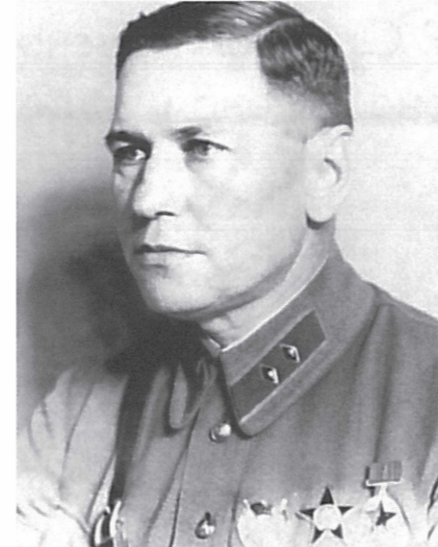
Генерал-лейтенант Осокин В.В. Начальник ГУ МПВО НКВД СССР с 1940 г. по 1950 г.

1937 – 1938 гг. – исполняющий обязанности начальника управления ПВО РККА комдив Блажевич И.Ф.