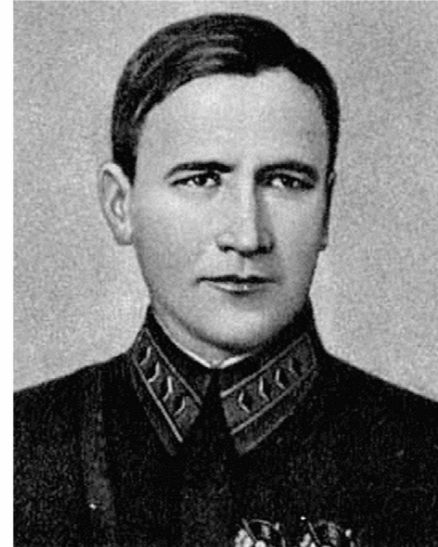
Командарм 2-го ранга Седякин А.И. Начальник управления ПВО РККА (МПВО)